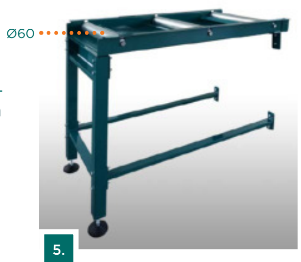
Rullakuljetin tyyppi "B"