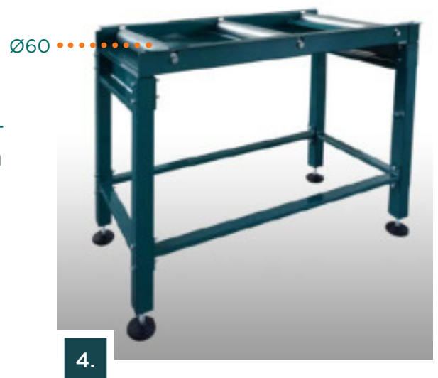
Rullakuljetin tyyppi "A"