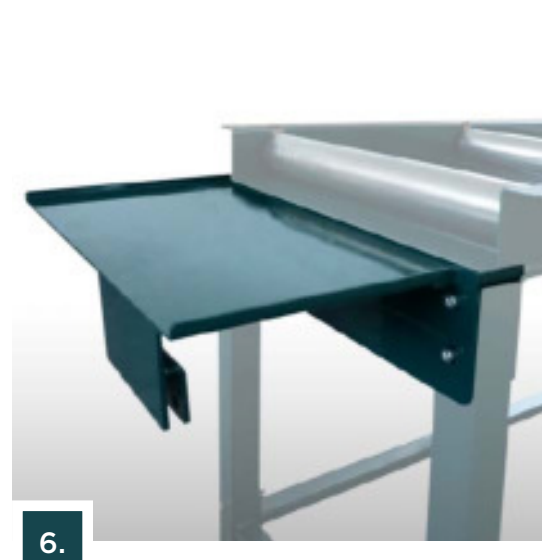
Taso tyyppi "C"